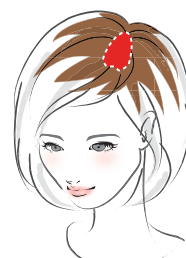
毛長 (シリーズ共通)