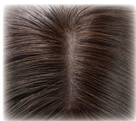
人工スキンネットで 分け目も自然