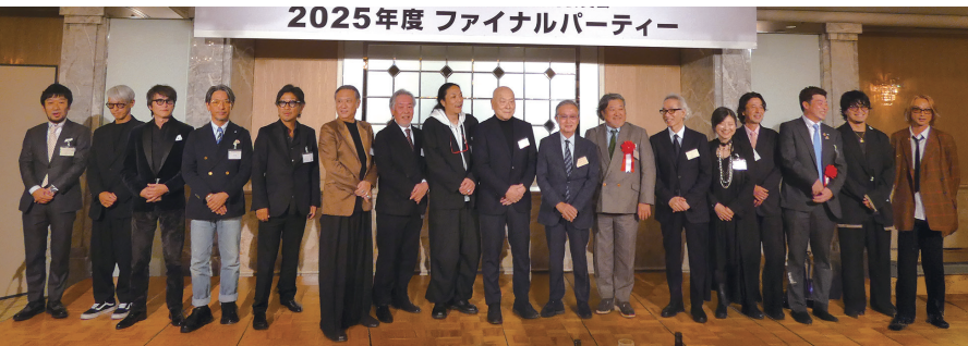
歴代実行委員長が登壇

人の心を癒やし、自己肯定感を育み、社会とのつながりを生み出す「美容の力」を通じて、社会貢献・環境配慮・次世代育成を柱に持続可能な未来づくりに取り組む。