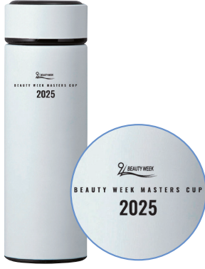
トロフィーのウォーターボトル