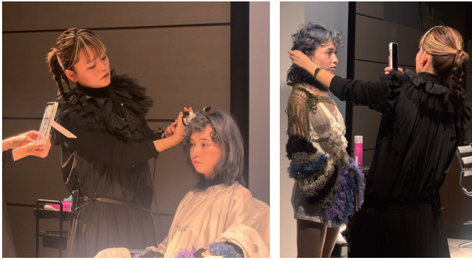
木坂桃歌氏によるフォトシューティングセミナー