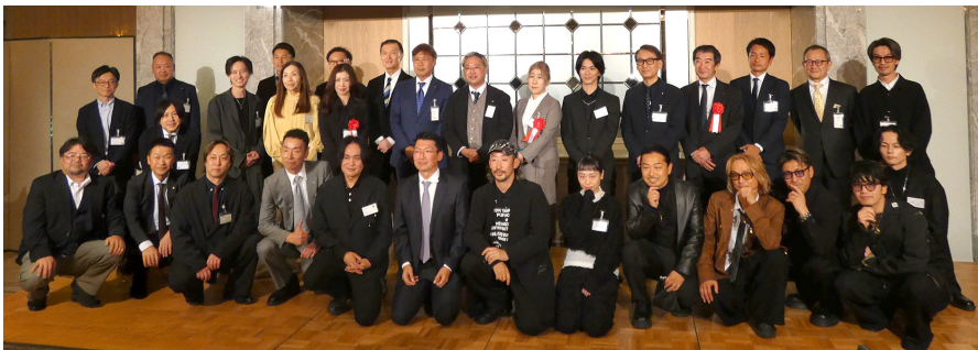
2026年度 次期執行部の紹介