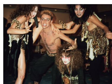
アーヴィン・ラスク・チームのステージPart1「ジャングル・ストーリー」の出演者たち。