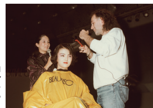
ユニセックスサロンの創始者ともいわれる「スマイル」のキース・ウエンライト氏は、「バンクヘアの鬼才」の異名をとる。