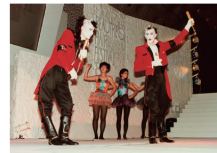
サンリッツ・グループのステージで目を引いたのはロンドンで人気のダンサー、ティク&タック。