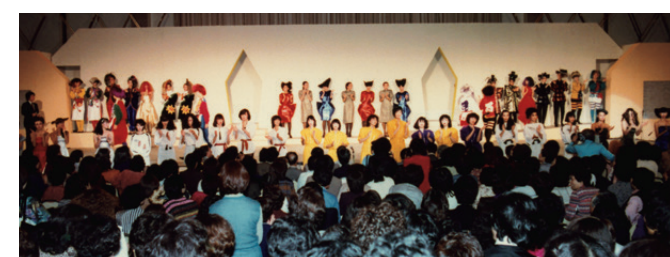
「ビューレックヘアフェスティバル'80」のグランドフィナーレ。

イギリスのオロ・パブリケーションズが刊行していた『ORO VISION』は、世界的トップアーティストの作品を網羅する季刊誌。当時、最も権威あるヘアファッション誌とされていた。その主催する国際的ヘアショーが「オロ・インターナショナルヘアフェスティバル」だ。