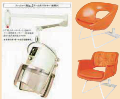
お釜タイプのドライヤーも全盛だった80年代。ドライヤー椅子のデザインも豊富だった。