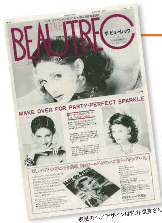
表紙のヘアデザインは荒井康友さん