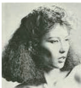
日本ヘアデザイン協会「80春夏ニューヘアモード」。テーマは「サクセス」