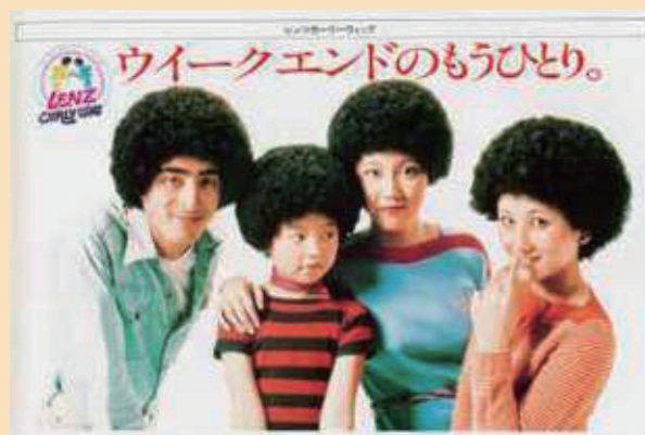
アフロのウィッグ「カーリー・ウィッグ」は、有名女優も出演するTVCMが流れる人気商品。

80年代のカatalogに多くのページを割いて紹介されていた商品をPick Up!