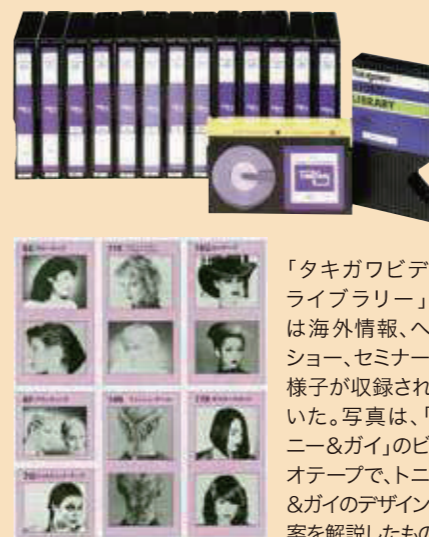
「タキガワビデオライブラリー」では海外情報、ヘアショー、セミナーの様子が収録されていた。写真は、「トニー&ガイ」のビデオテープで、トニー&ガイのデザイン提案を解説したものの。