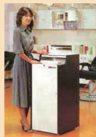
情報がアナログだった80年代。カルテボックスも大きく、写真のようなサイズが重宝された。