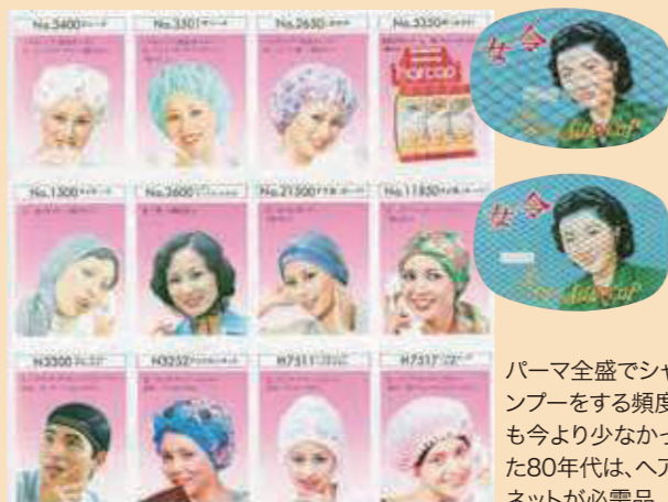
パーマ全盛でシャンプーをする頻度も今より少なかった80年代は、ヘアネットが必需品。