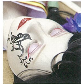
まつ毛エクステンション (ウィッグ競技) 金谷空実さんの作品