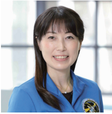
山崎 直子 氏 宇宙飛行士

千葉県松戸市生まれ。1999年国際宇宙ステーション (ISS) の宇宙飛行士候補者に選ばれ、2001年認定。2010年4月、スペースシャトル・ディスカバリー号で宇宙へ。ISS組立補給ミッションSTS-131に従事した。2011年8月JAXA退職。内閣府宇宙政策委員会委員、日本宇宙少年団 (YAC) アドバイザー、日本ロケット協会理事・「宙女」委員長、ふたばの教育復興応援団などを務める。