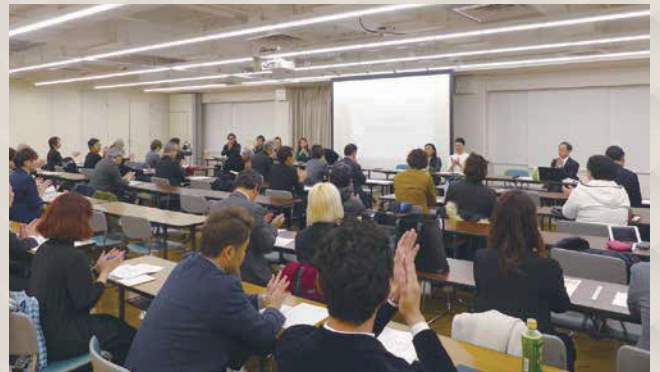
実行委員会の様子

「All for the customer. ～すべてはお客様のために～」 お客様のニーズをしっかりと引き出せるプロのヘアデザイナーになるために、 単発的なイベントではなく、流動的にお客様や学生、美容師が参加できる 「消費者参加型」のイベント・コンテストを通じて、一人でも多くのお客様が 美容週間の会員サロンに足を運んでいただける企画を考え活動していく。